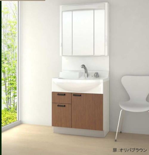
W=750mm 片引き出しタイプ ラウンドボウル